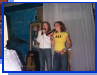
Stimmung am Abend