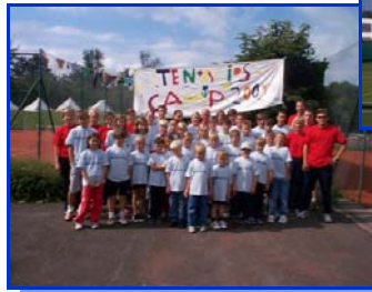
Höhepunkt des Jahres: Das Tenniscamp