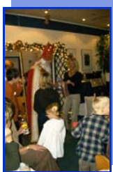
Der Nikolaus kommt