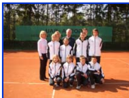
Tennis im Team