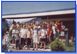
Fahrt zu den Gerry-Weber-Open