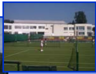
Campausflug zum Rasentennis nach Halle